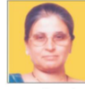
मा. न्यायमूर्ती रंजना देसाई न्यायमूर्ती, मुंबई उच्च न्यायालय, मुंबई व कार्यकारी अध्यक्षा महाराष्ट्र राज्य विधी सेवा प्राधिकरण