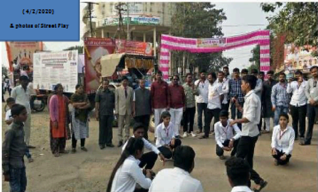
Photos of Legal awareness through Digital Posters through Chitrarath on occasion of Birth Anniversary of Karmveer Nana Jigdale. ( 4/2/2020 ) & photos of Street Play